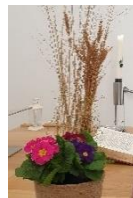
Schikking 1 e zondag

Een ervaring die alle werkelijkheid tart. Jezus, Gods zoon!